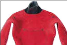
エントリー部オール起毛オプション 3,300円(税込)

COLOR: B ダークグリーン C ダークグリーン MARK: 襟元 7WT 右手首 7WT 腰 1WT 背中 1WT