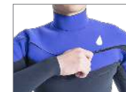
CHEST ZIP SYSTEM