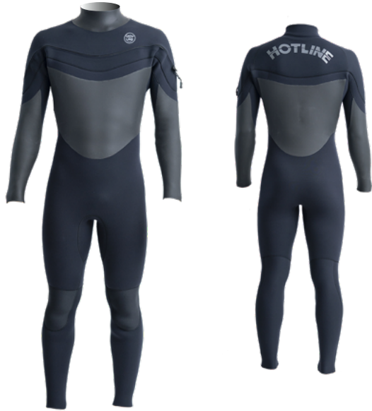
MARK: エリ元 4GY 背中 1GY