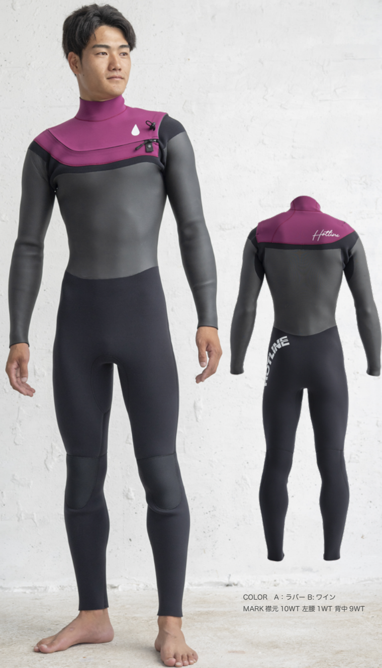
COLOR A: ラバー B: ワイン MARK 襟元 10WT 左腰 1WT 背中 9WT