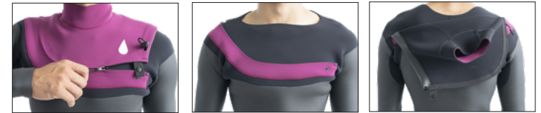
ドローコードでフラップの締め付けを調節