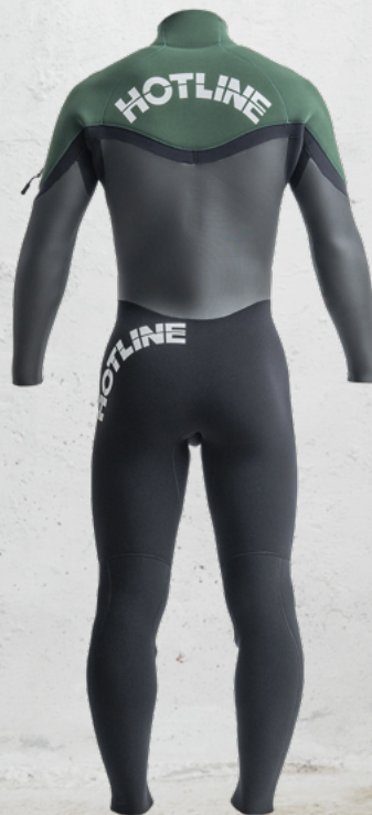
COLOR A: ラバー B: Dグリーン MARK 襟元 10WT 左腰 1WT 背中 1WT

HOTLINE の LIMITED シリーズ、23-24AW では LIMITED でも最新のテクノロジーを搭載。好評頂いているチェストジップはもちろん NEW ZIP SYSTEM の L-ZIP も登場。L 型に配置された ZIP は他のタイプ以上の運動性能を持ち、かつスタイリッシュな ZIP。