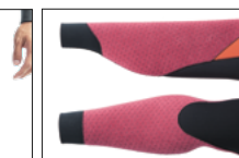
WRIST & ANKLE BACK J-CUFF