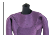
ENTRY PANEL LINING