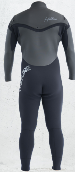
COLOR A: ラバー B: ブラック C: ラバー MARK 襟元 10GY 左腰 1GY 背中 9GY

2019年に開発し2020年SSから発売開始になったニューフライジップシステム。Uの字にレイアウトされた伸縮ファスナーが作る広い開口部、HOTLINEオリジナル開発の搭載型で稼働性が向上しました、更にフラップサイドからの浸水も軽減し23年AWからエントリー部も起毛になり保温性も大幅にアップしました。快適な着用感と運動性能を持つ最上級のウェットスーツ。若干脇まちにゆとりをもたせています。