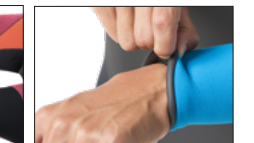
REPEL CUFF リベルカフ無料 指定の無い場合は切りっぱなし