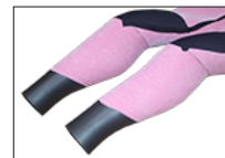
WATER BLOCK CUFF +2,000 (足首のみ対応)