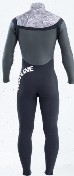
COLOR B: パンパーモノクロ MARK 襟元 10WT 左腰 1WT 背中 9WT