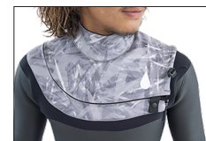
ドロコードでフラップの締め付けを調節