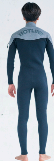
COLOR A: ネイビー B: メランジ BK MARK 襟元 4GY 背中 1GY