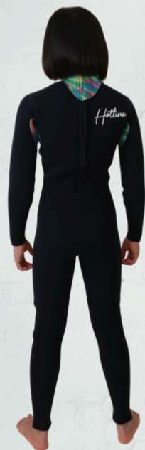
COLOR B: パンプーカラー MARK 胸 8WT 背中 9WT