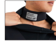
NECK IN SYSTEM (ネックリングW標準)