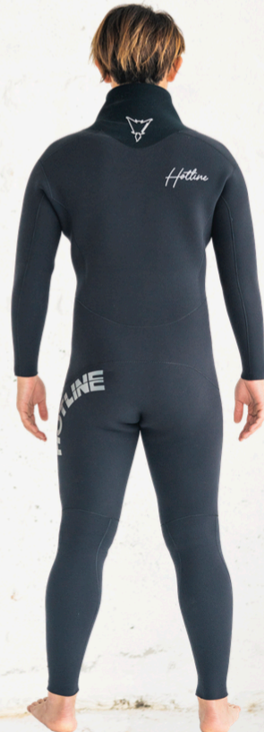
COLOR A: ブラック B:ブラック C:ブラック MARK 胸 4WT 背中 9WT 腰 1WT