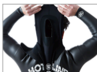
W-NECK BARRIER ¥3,000