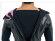
JAZZ BARRIER (標準装備)

パッチカルジップ採用モデルのFUNKが復活しました。特性上水が入りやすく夏場でも着やすく身体のラインを細く美しく見せるクラシックスタイル。背中に動作を妨げるパーツが無い事によりネックイン並みの稼働性を実現。