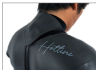
TOO FIT THE NECK