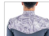
WATER DROP HOLL