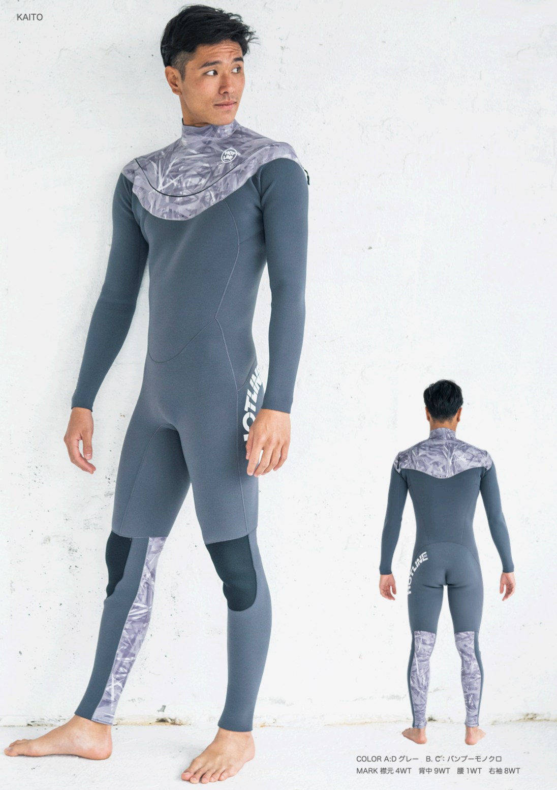
COLOR A:D グレー B. C: パンパーモノクロ MARK 襟元 4WT 背中 9WT 腰 1WT 右袖 8WT