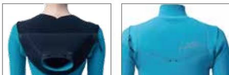
AMALFI NECK & WATER DROP HOLL