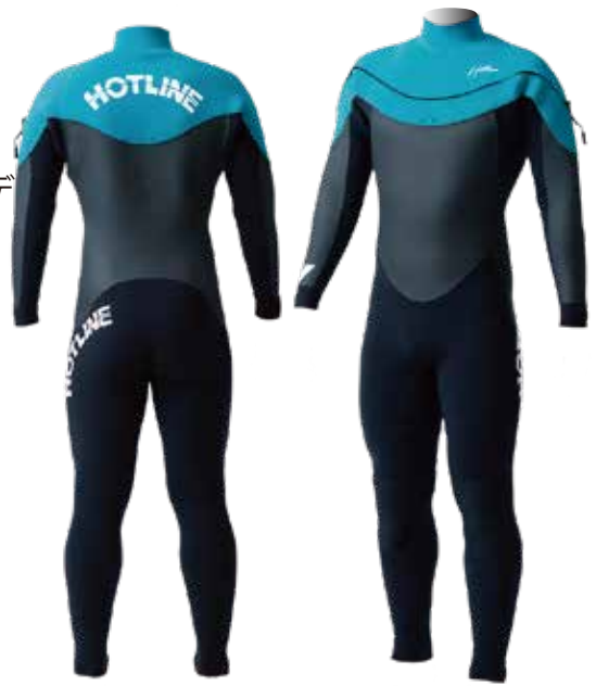
COLOR: B ターコイズ C ブラック シングルネック仕様 (標準ラップネック)