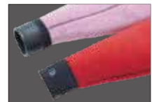
WATER BLOCK CUFF