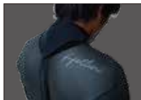
TOO FIT THE NECK