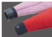
WATER BLOCK CUFF