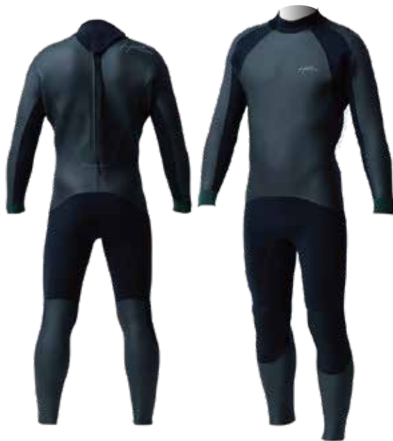
COLOR: B ブラック MARK: 胸 8GY 背中 9GY

シンプルなカッティングで過酷なヘビーウォーターにも対応可能なクラシックモデル、オールラウンドに活躍するバックジップモデル。バリアーエントリーユニットを採用し、防水ジップを装着しなくても、ジップからの浸水を極力防ぎ高い防水性を確保したHOTLINE 定番のバックジップモデル。