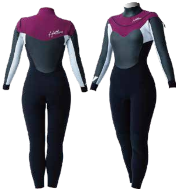
COLOR: B ワイン C ホワイト D ブラック MARK: 襟元 8WT 右手首 7WT フラップ後 9WT

2019年に開発し2020年SSから発売開始になったニューフライジップシステムのウィメンズモデル。Uの字にレイアウトされた伸縮ファスナーが作る広い開口部、HOTLINE オリジナル開発のW-DOORS ENTRYで着脱もイージーにそして従来のシステムでカバー出来なかったフラップサイドからの浸水をシャットアウト。今期よりエントリー部起毛が標準になりました